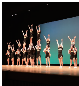
君津を元気に!Honeysも出演しました