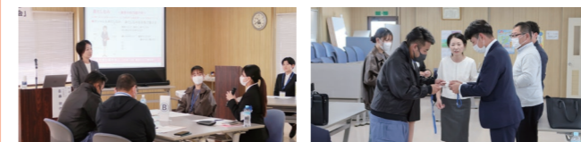
写真は昨年(2025年度)の研修会の様子