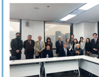
日商ソウル事務所の角館所長と

3・4日目は韓国第2の都市・釜山へ移動し、古くからの名所や話題の観光スポット等を視察しました。